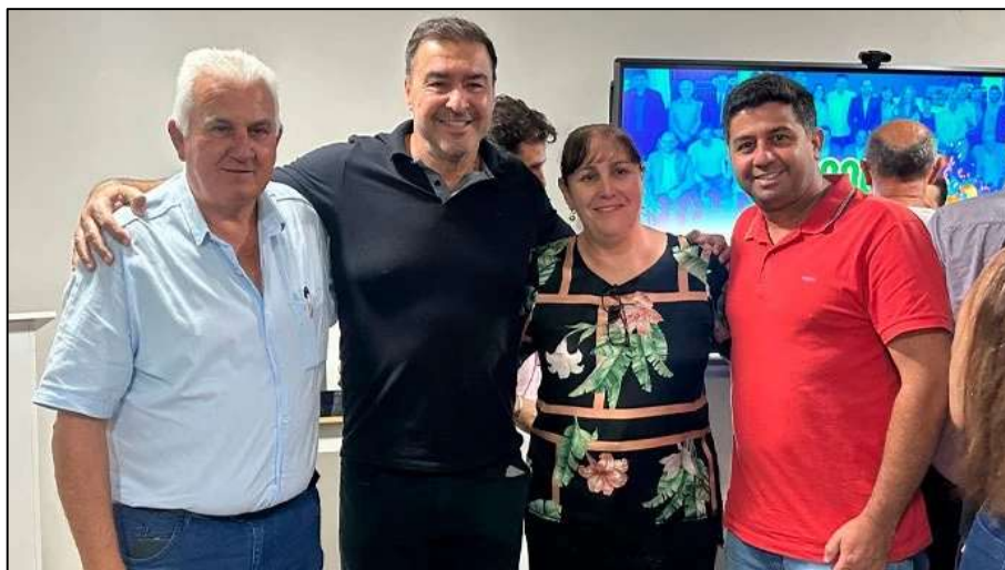
Figura 11 – Nova composição da Assembleia de Prefeitos da ARVAP para o ano de 2026.