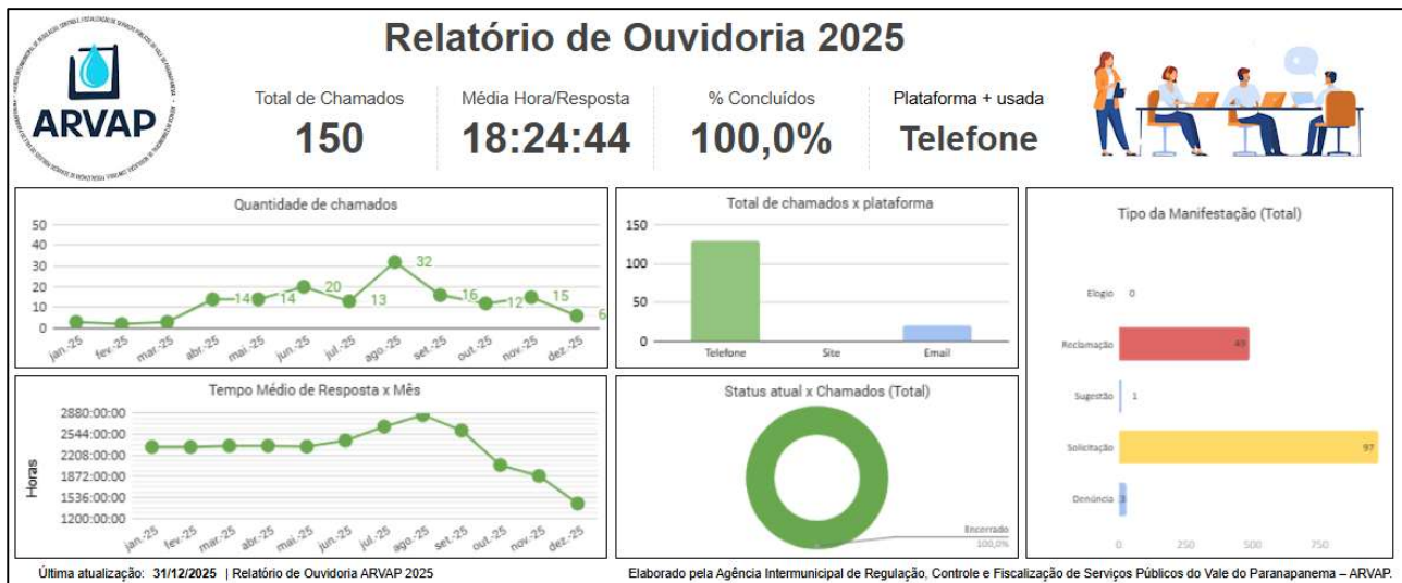
Figura 15 - Relatório de Ouvidoria ano 2025.