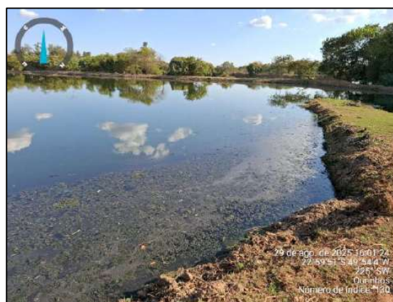
Figura 9 – Imagens das ETE's atuais de Ourinhos. A esquerda ETE rio Pardo, a direita ETE rio Paranapanema.