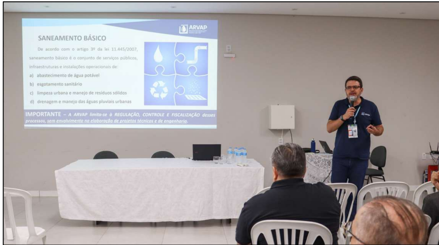
Figura 1 – Participação da ARVAP na I Conferência Intermunicipal do Meio Ambiente do Vale do Paranapanema (CIMA-VAP).

realidade dos municípios e para o fortalecimento de iniciativas voltadas à gestão pública regional.