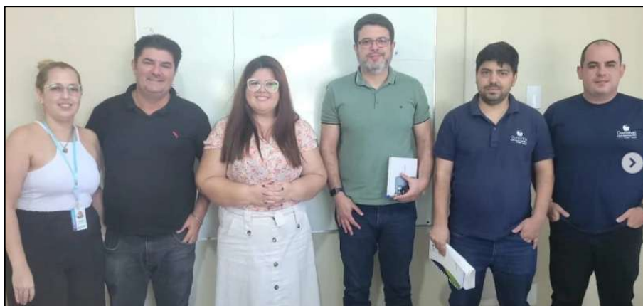
Figura 4 – Reunião com a Secretaria de Assistência Social de Ourinhos juntamente com a Ourinhos Saneamento para tratar da implantação da Tarifa Social no município.

Em 25/03/2025 a ARVAP participou da capacitação “Regulação e Gestão do Saneamento Básico”, promovida pelo Comitê da Bacia Hidrográfica do Rio Paranapanema, em Piraju/SP, voltada ao debate sobre regulação, metas de universalização e desafios do saneamento básico nos municípios da região. A participação da Agência integrou as ações de acompanhamento técnico e articulação institucional relacionadas ao Novo Marco Legal do Saneamento, contribuindo para o fortalecimento do diálogo regional e para o aprimoramento das discussões sobre gestão e regulação dos serviços públicos de saneamento.