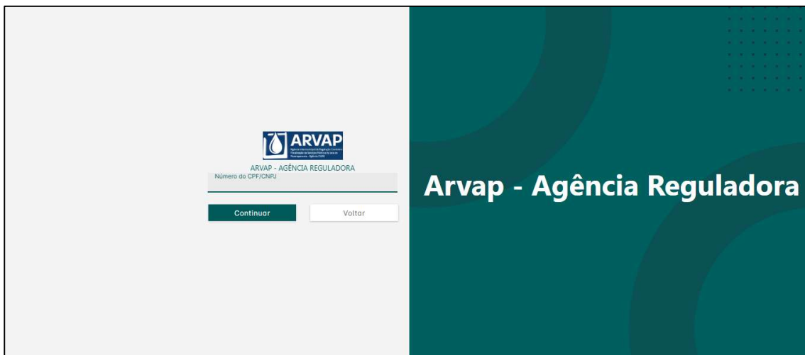
Figura 12 – Página inicial do sistema de ouvidoria.

Durante o ano houve a implantação do sistema de Ouvidoria via sistema dedicado, link de acesso: https://arvap.flowdocs.com.br/credentials/solicitar-acesso .