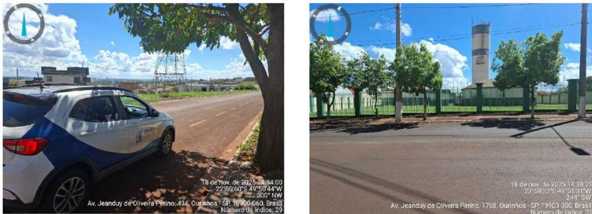
Figura 10 – Pontos da cidade de Ourinhos.

Hospital de Olhos, Santa Casa, Base Ipiranga, Colégio Santo Antônio, Catedral, Correio Central e Shopping Cinemark , foi constatada normalidade na execução dos serviços. Ao longo da rota inspecionada, não foram identificadas frentes de obra, intervenções viárias ou situações que comprometessem a continuidade dos serviços. Foi verificado que o sistema de saneamento básico se encontrava plenamente funcional, sem registro de anomalias ou ocorrências que demandassem ações corretivas imediatas.