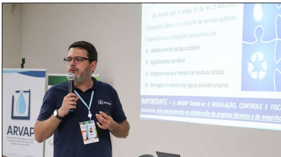
Figura 2 – Participação da ARVAP na I Conferência Intermunicipal do Meio Ambiente do Vale do Paranapanema (CIMA-VAP).