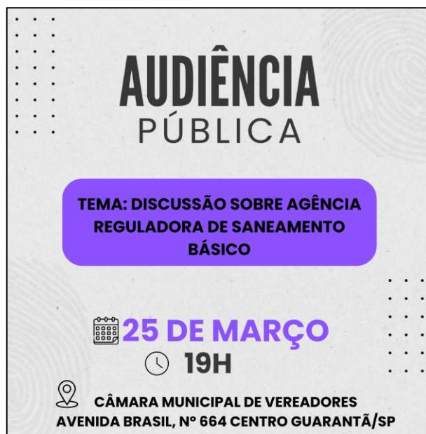
Figura 5 – Divulgação da audiência pública.

A audiência foi divulgada pela internet, link: https://www.youtube.com/live/D6vpyjfl1U4?si=cYk6UwvoHmJnmruN