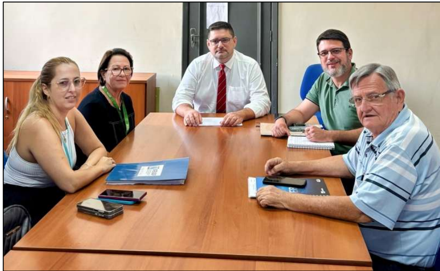
Figura 6 – Reunião da ARVAP com a Prefeitura de Ourinhos.

Em 3 de abril na sede da Serviço Autônomo de Águas e Esgotos de Garça a ARVAP realizou a apresentação da agência para os municípios do Consórcio Intermunicipal do Centro Oeste Paulista (CICOP).