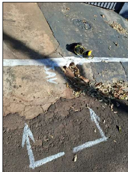
Figura 8 - Ação de fiscalização da geofonia em Ourinhos.

A ARVAP acompanhou o início da aplicação da Tarifa Social de água e esgoto no