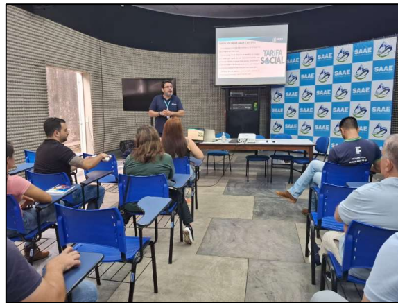
Figura 7 – Apresentação da ARVAP da sede do Serviço Autônomo de Águas e Esgotos de Garça para os municípios do CICOP.

Em 9 de abril via videoconferência a ARVAP realizou a apresentação da agência para o município de Lins.